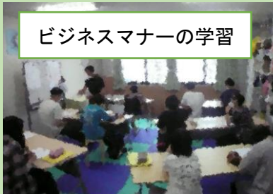
ビジネスマナーの学習