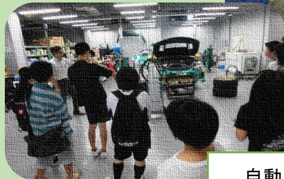
自動車工場の見学

ビジネスマナーの学習や工場見学へ行き体験を通して学ぶことを大切に取り組んでいます。