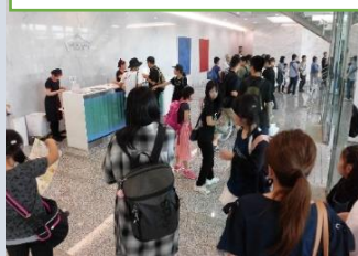
群馬のお菓子工場へ