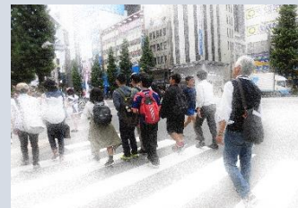
自主企画で秋葉原へ